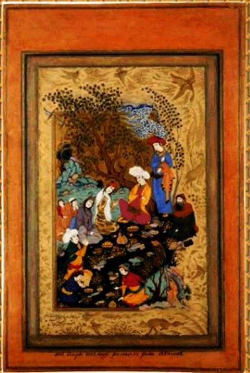
بیت از حافظ شیرازی در وصف باغ و گلستان

بخواند می شد که نوبه و برآید رسیه از کاش شسته نوبی بر سجده زان اولی در جادو قطره و تماشای نوبی بر سجده نیز هم در جادو قطره بیت سرودی است تماشای زهی از شش بر زمان نوبی بشنیدم که بر این بیت مگر ترسید پس کجا براهی