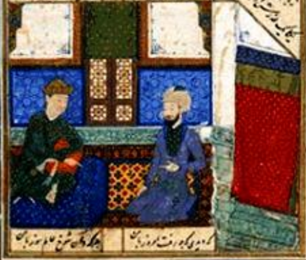
کامری که رفت کوزبان چگونه سخن نام نوزبان

مجلس از کسر است تیران کشته و کارد است تیران مجلسی که در باغ و گلستان