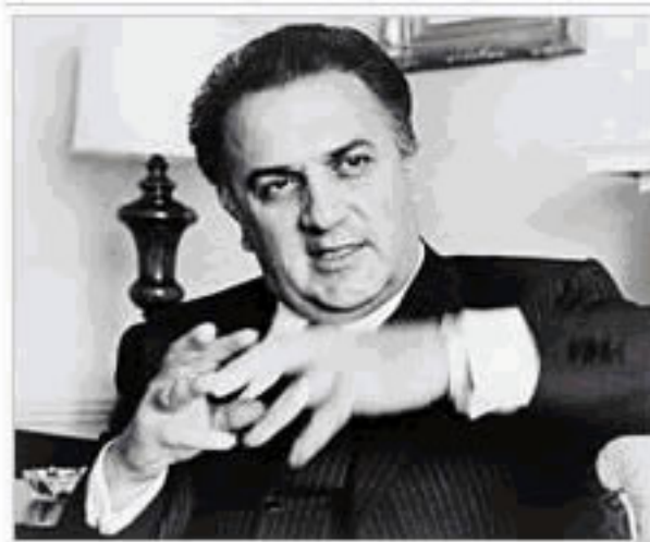
Federico Fellini (1920-1993)