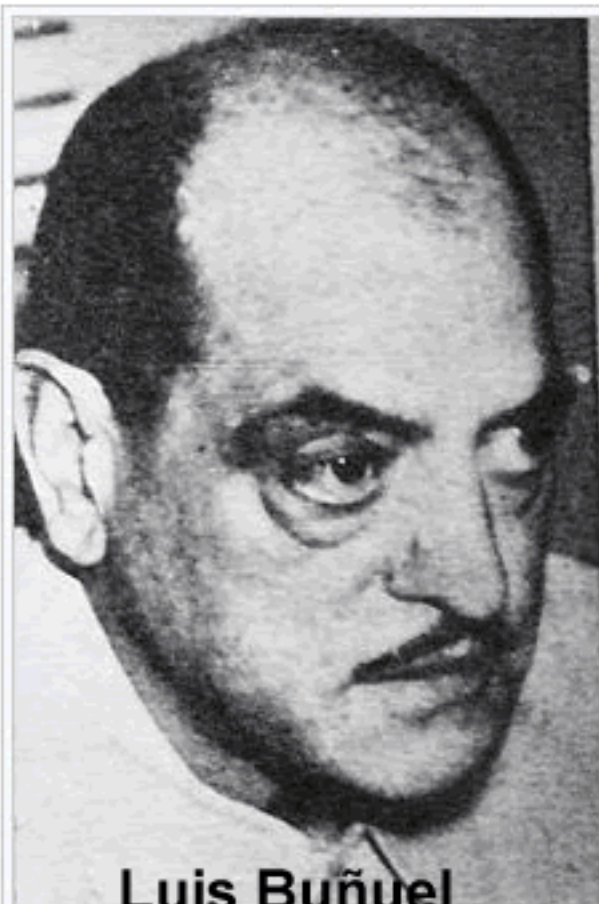
Luis Buñuel (1900-1983)