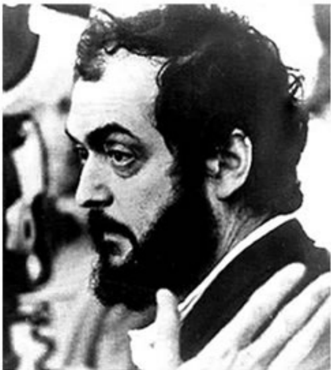
Stanley Kubrick (1928-1999)