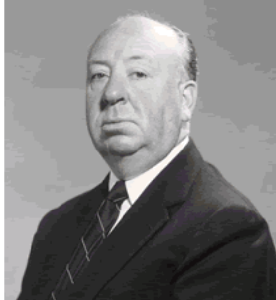
Sir Alfred Joseph Hitchcock (1899-1980)