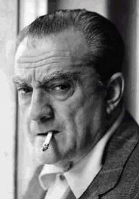
Luchino Visconti (1906-1976)