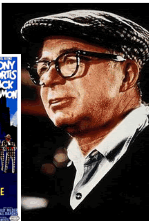
Billy Wilder (1906-2002)