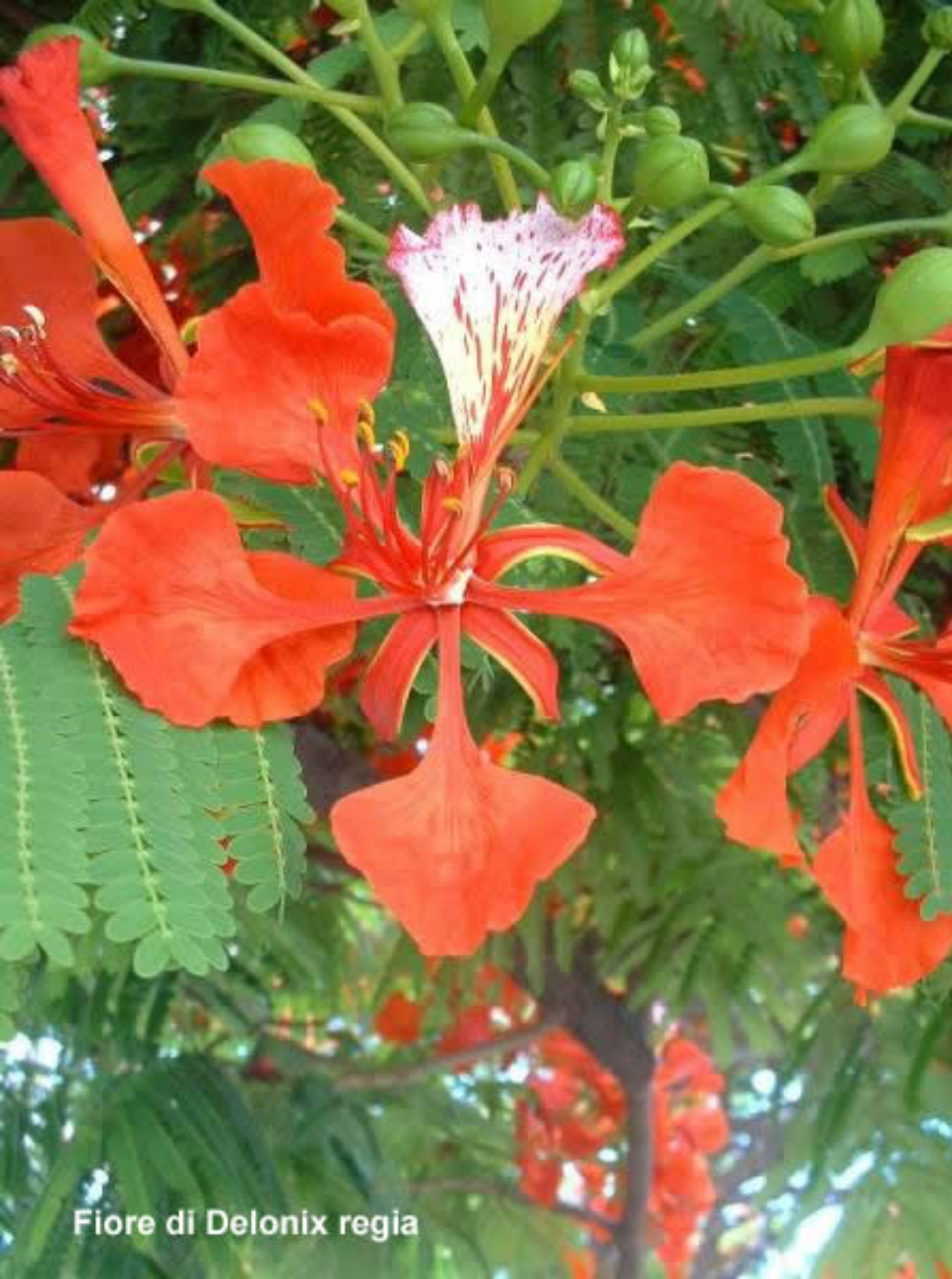
Fiore di Delonix regia

Maria Sibylla Merian (Francoforte sul Meno, 2 aprile 1647 – Amsterdam, 13 gennaio 1717) è stata una naturalista e pittrice tedesca.