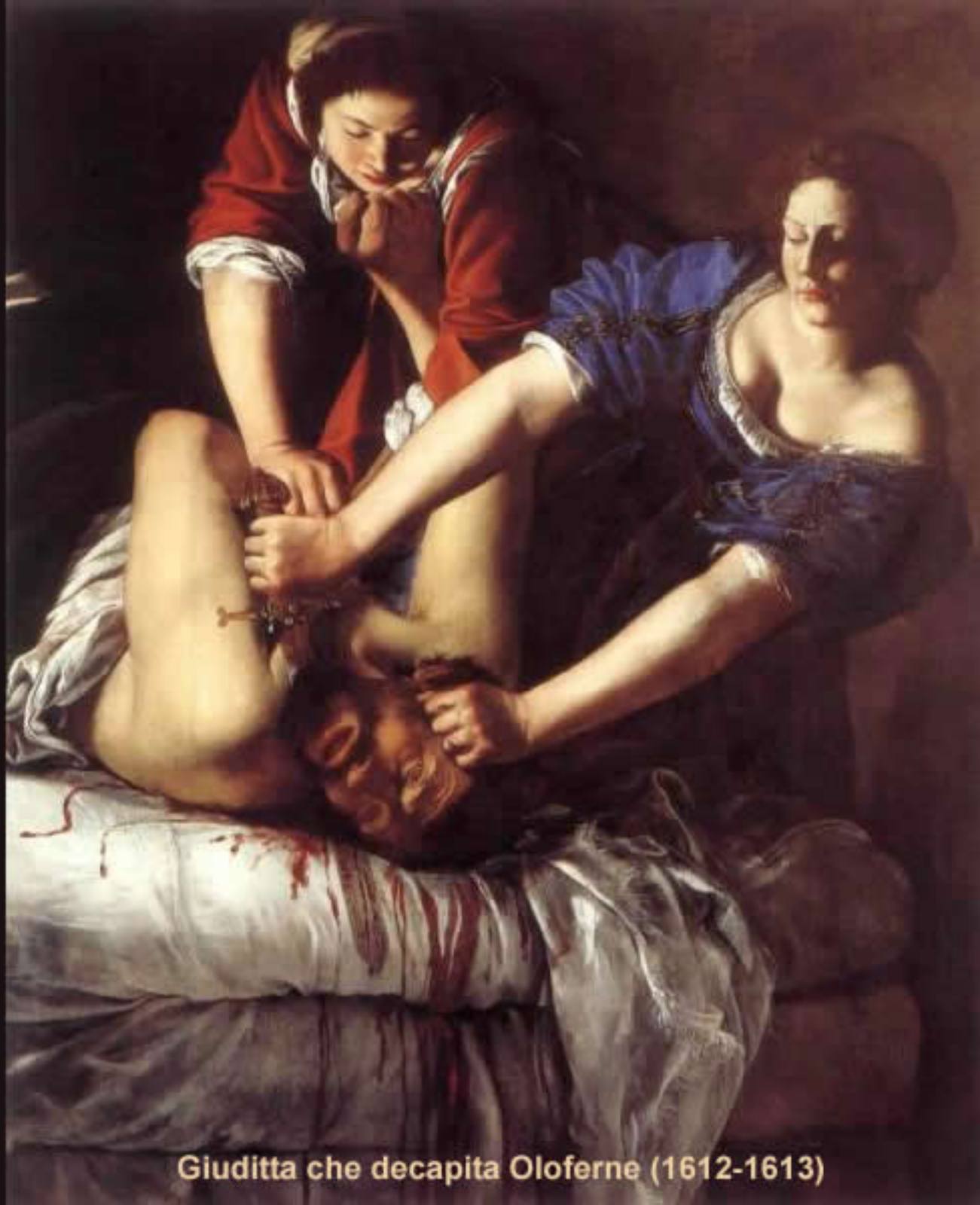
Giuditta che decapita Oloferne (1612-1613)

Artemisia Lomi Gentileschi (Roma, 8 luglio 1593 – Napoli, post 31 gennaio 1654) è stata una pittrice italiana di scuola caravaggesca.