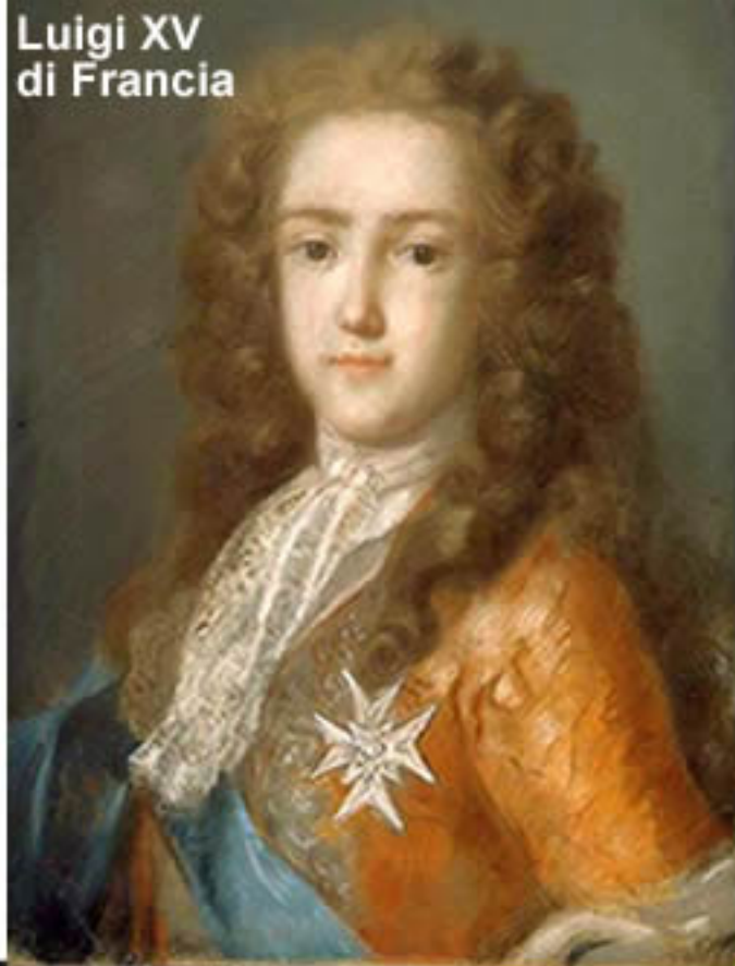
Luigi XV di Francia

Cominciò la sua carriera artistica dipingendo le tabacchiere con quelle figure di damine graziose che divennero poi la sua fortuna trasposte nelle miniature su avorio.