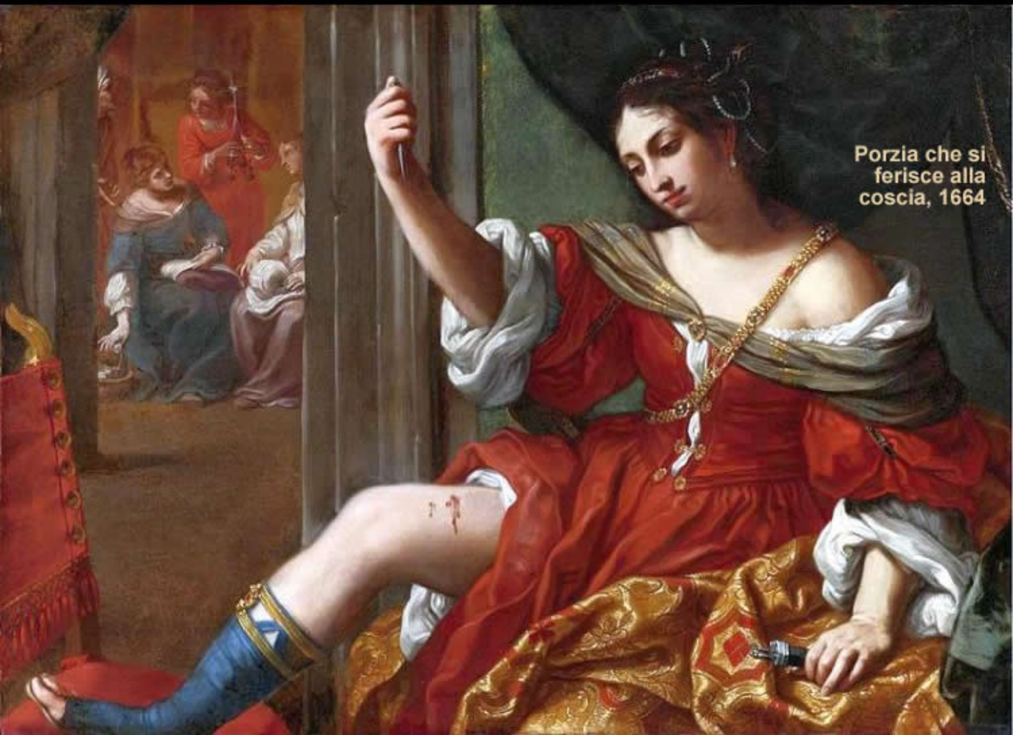
Porzia che si ferisce alla coscia, 1664

Elisabetta Sirani (Bologna, 8 gennaio 1638 – Bologna, 28 agosto 1665) è stata una pittrice e incisore italiana, di stile barocco.