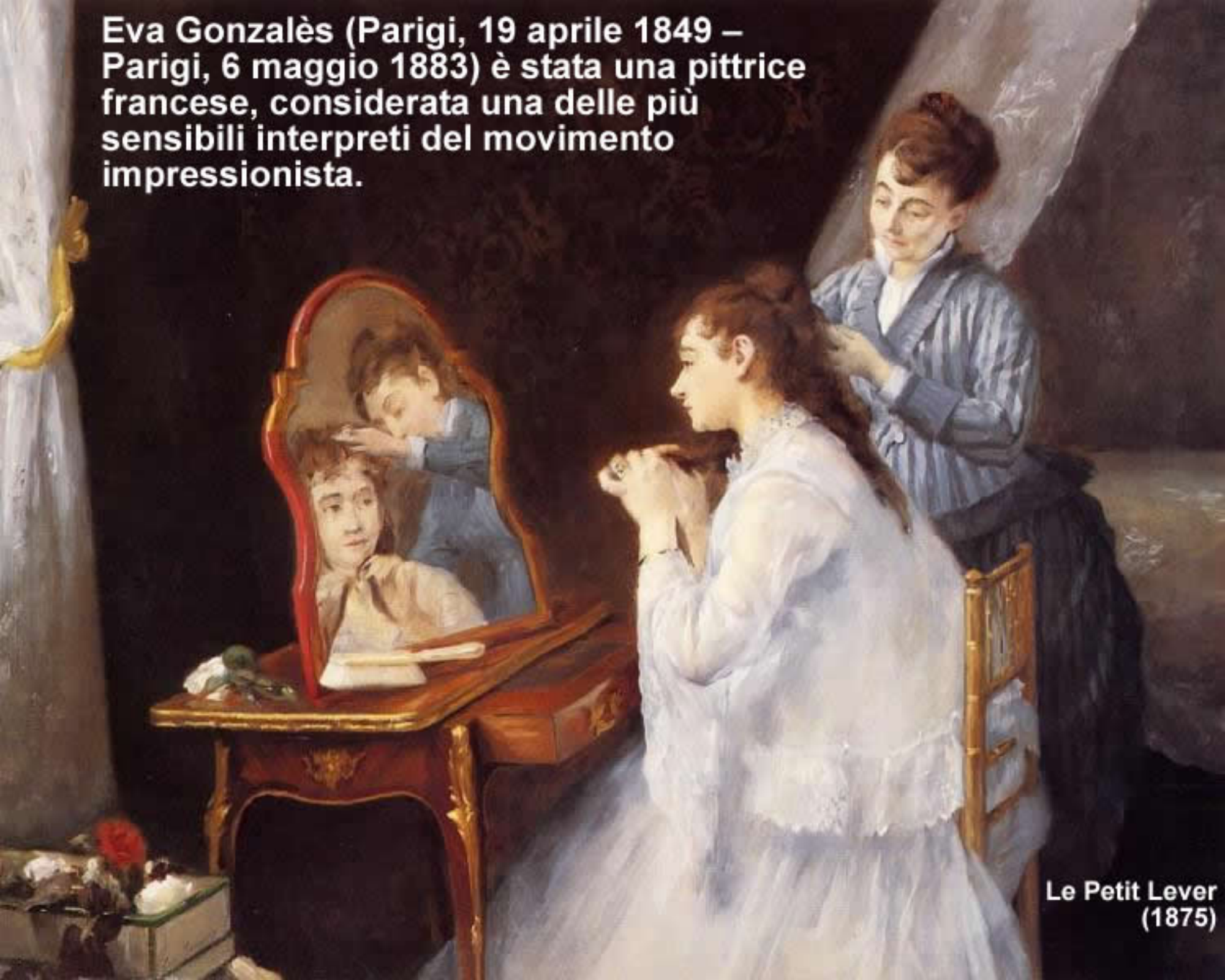
Le Petit Lever (1875)

Eva Gonzalès (Parigi, 19 aprile 1849 – Parigi, 6 maggio 1883) è stata una pittrice francese, considerata una delle più sensibili interpreti del movimento impressionista.